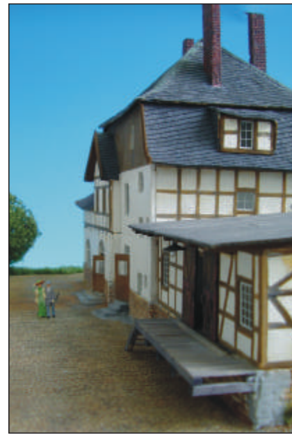
Alle Abb. Handmuster